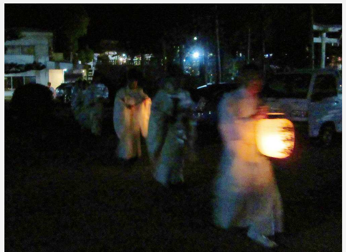
神殿より御神火が運ばれます(午後 11 時 43 分)