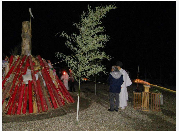
火入れ準備 (午後 11 時 58 分)