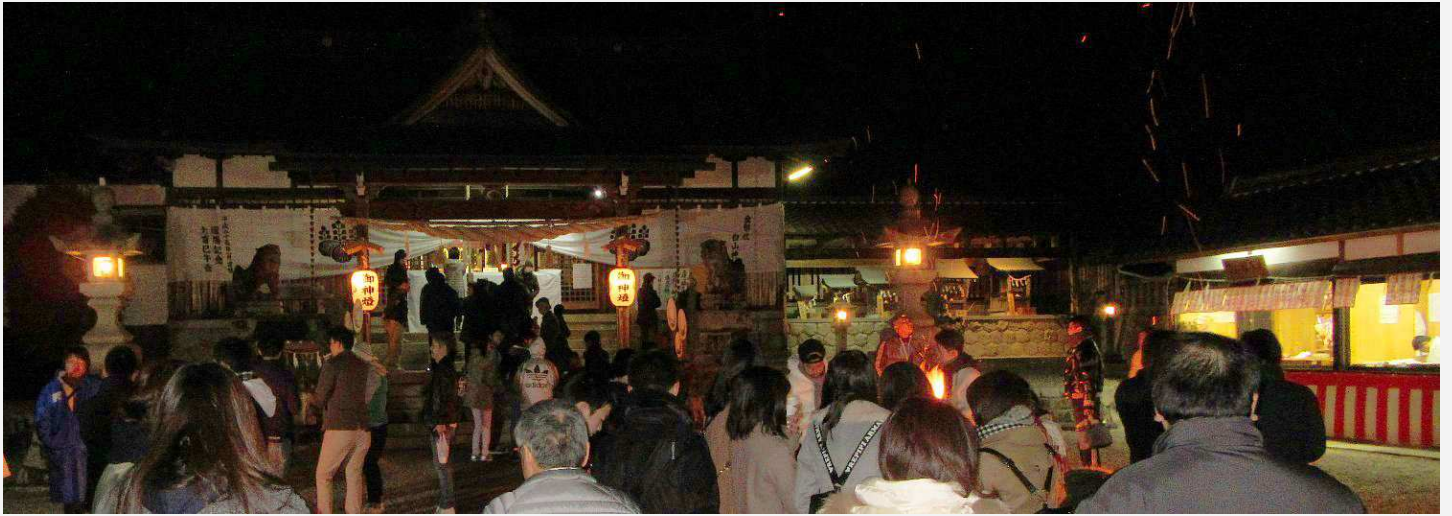
拝殿前 (午後 11 時 38 分)