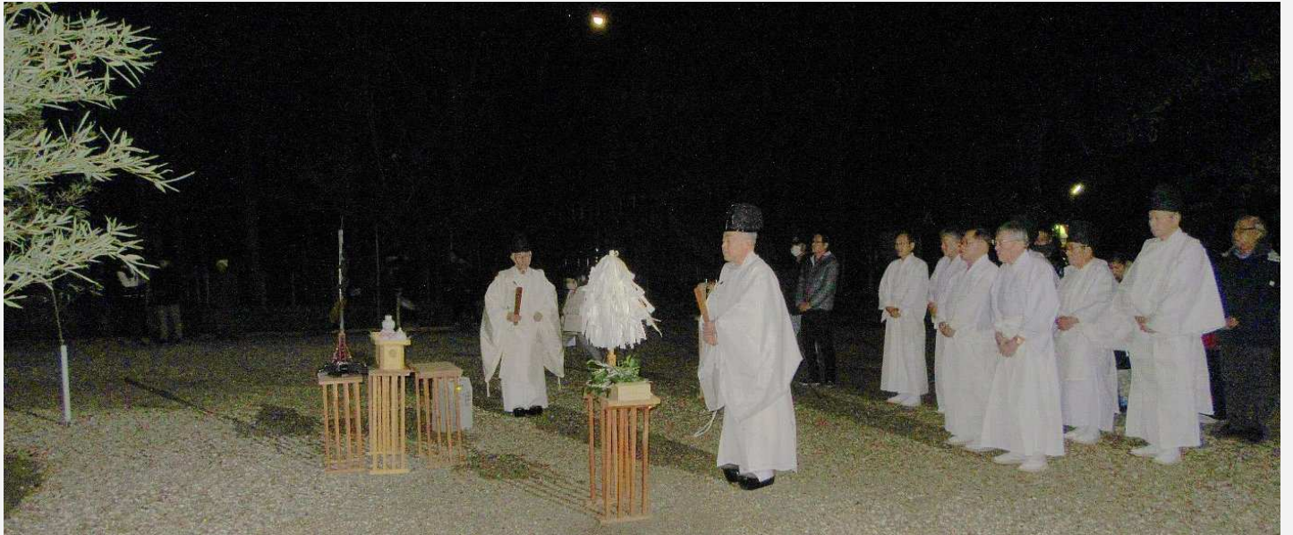
神事 (午後 11 時 48 分) 月が見守る中、宮司等神社関係者・区長・申年代表が玉串を奉納