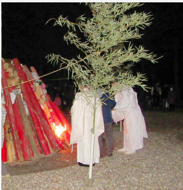
火入れ (午後 11 時 59 分)