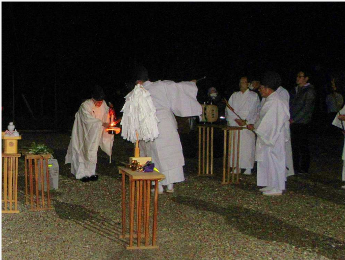
御神火より採火 (午後 11 時 57 分)