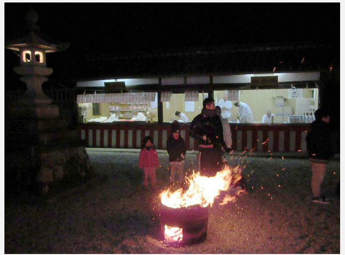
神札・破魔矢・おみくじ授与所