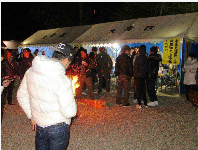
厄年会による ぜんざい・甘酒・お酒の振舞い