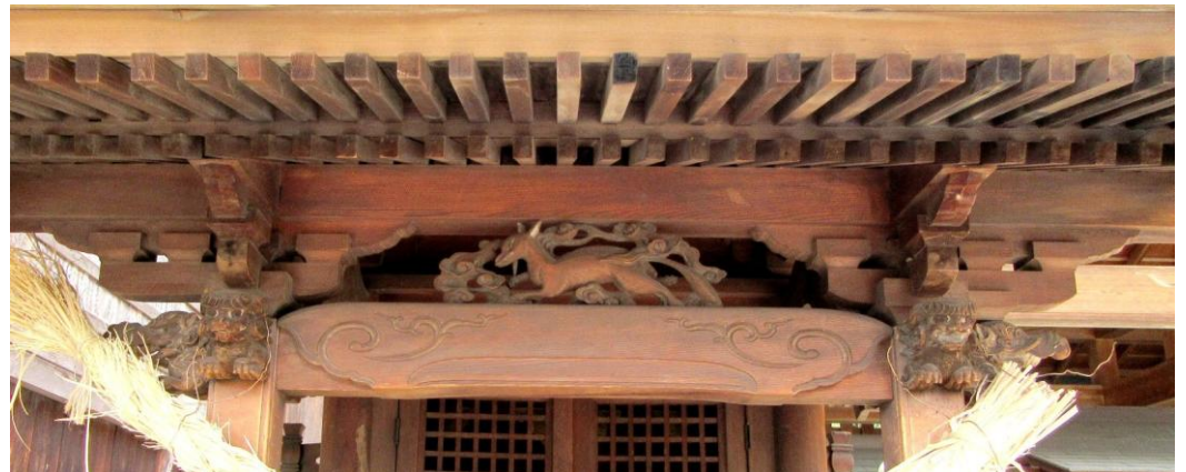
中央にきつね、左右に狛犬が彫られています