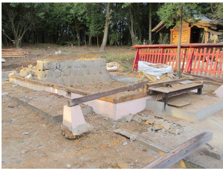
建物は完全に撤去されました