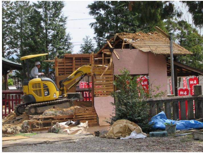
石積みを壊して重機を進める