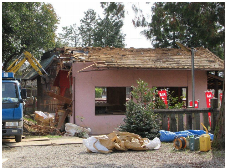
瓦の撤去が終わり屋根部分より壊す(6日)