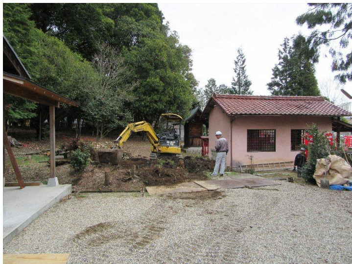
まず重機を入れるため斜面を平らに(5日)