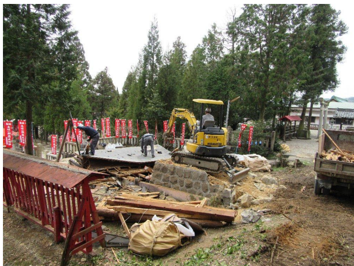
底の金具を手で取り外す