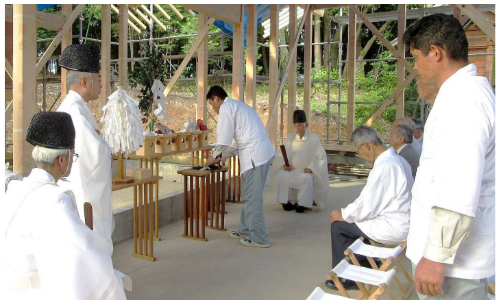
玉串奉奠 丸山建築代表