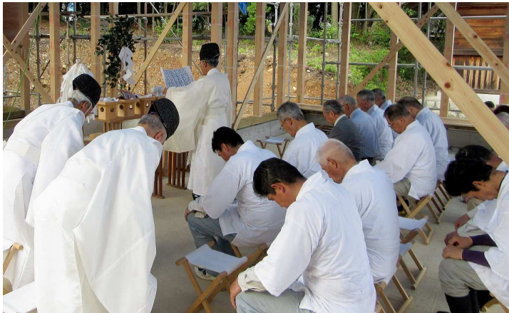
祝詞奏上 (のりとそうじょう 17:13)