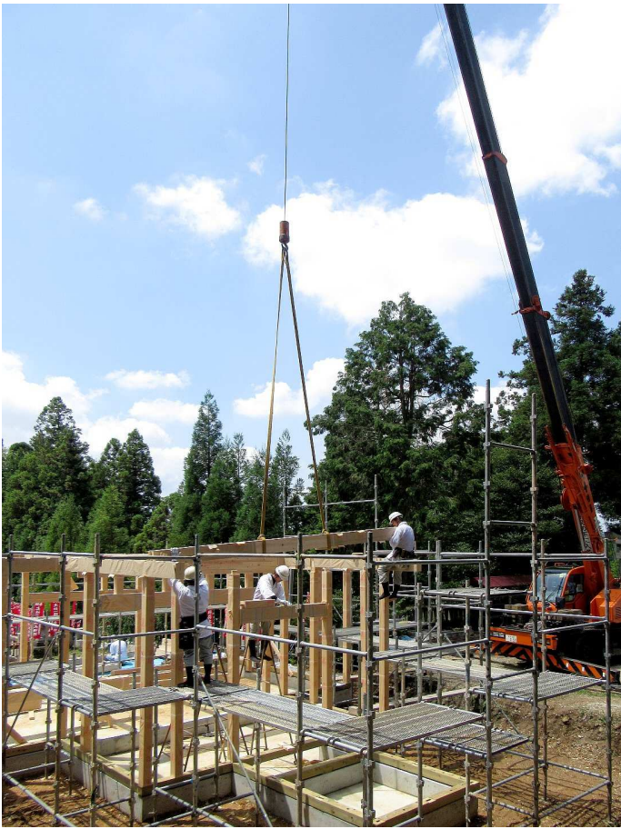
6 月 30 日

30℃を越す蒸し暑い梅雨空の下、午後 5 時より建設委員会・建設業者代表者が参加し、急遽上棟祭が行われました。(6月29日より足場の設置が行われ30日には柱、1日には棟までと急ピッチで作業が行われていました)