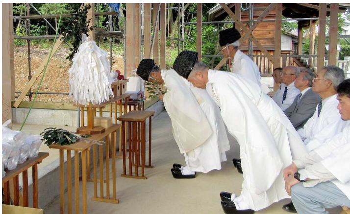
玉串奉奠(ほうてん) 祭主