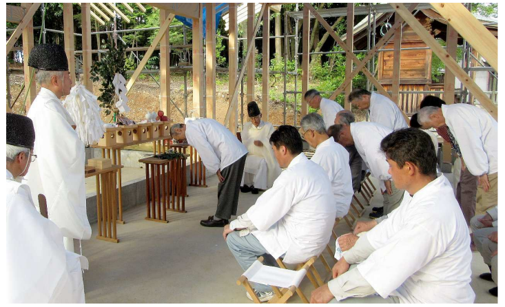
玉串奉奠 松澤神社代表