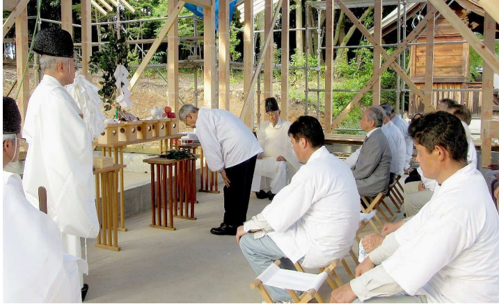
玉串奉奠 加納神社顧問代表