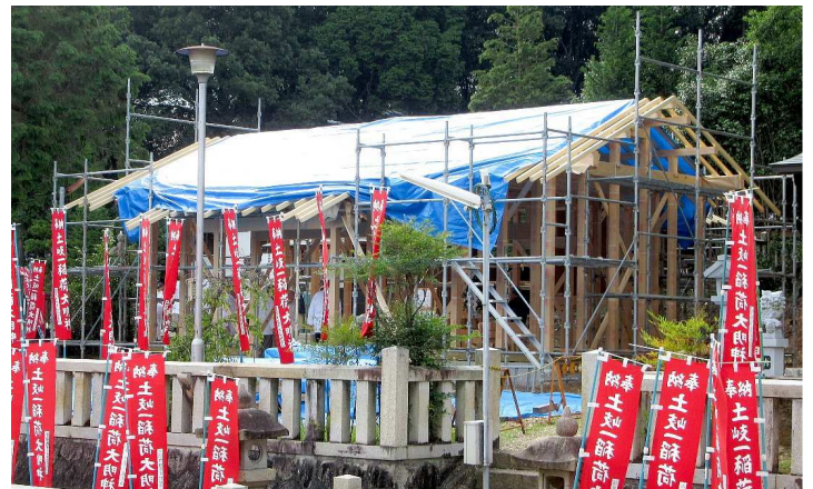
7 月 2 日 (16:47)