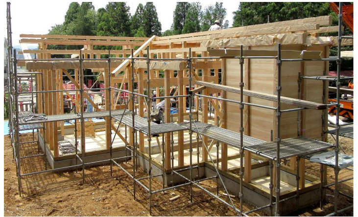
7 月 1 日