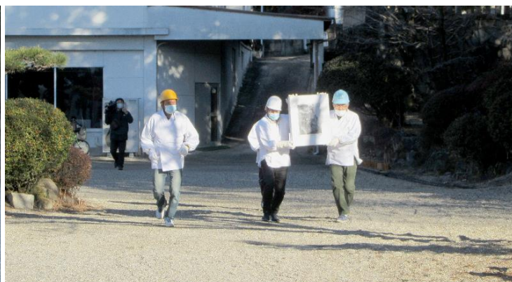
文化財を持ち出す (9:03)