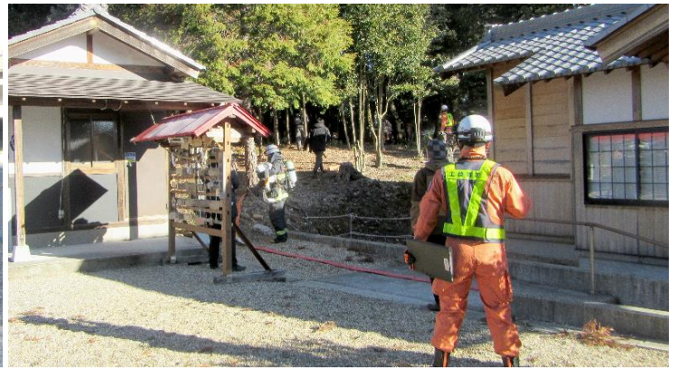
東の森にホースを引き込む