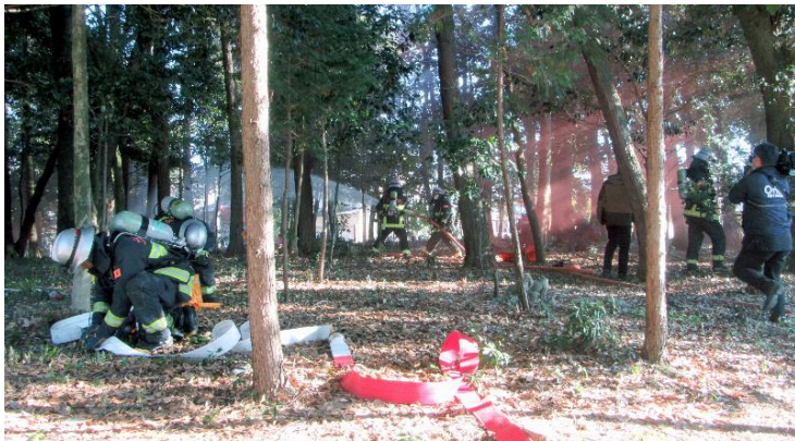
奥で放水開始 手前では水幕ホースを設置中