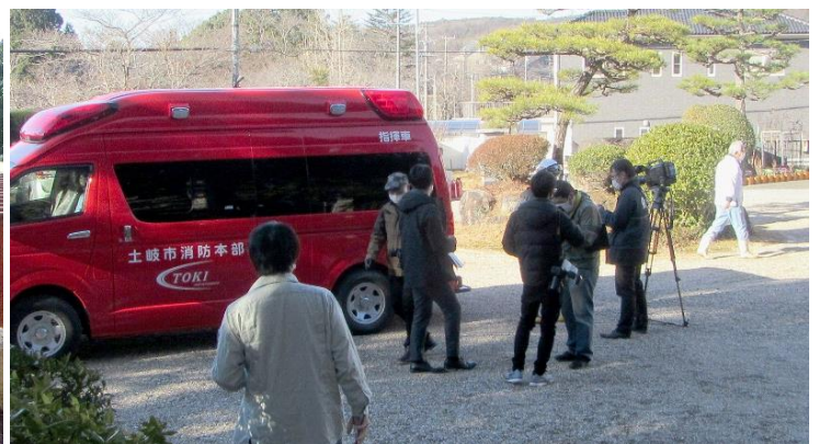
報道関係者に説明