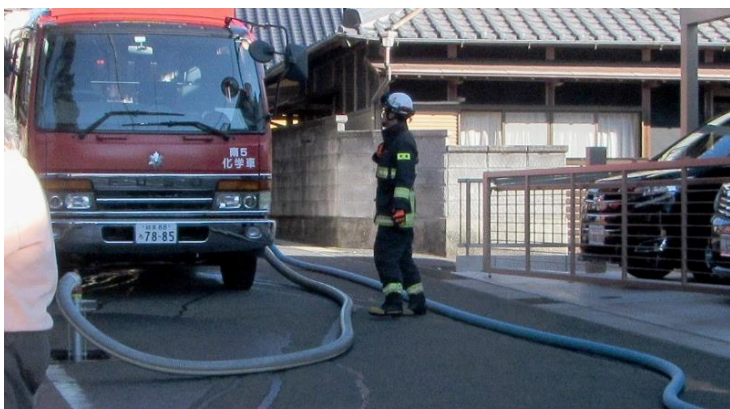
消火栓の水の圧力を上げて別の消防車に供給