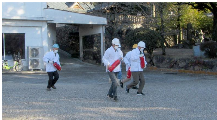
初期消火のため消火器を持って現場に急行 (9:01)