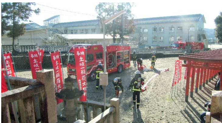
訓練終了 片付け (9:30)