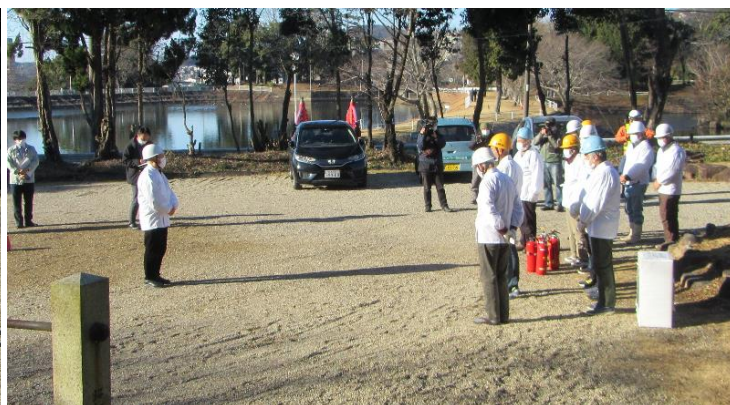
訓練終了 (9:05) 宮司挨拶