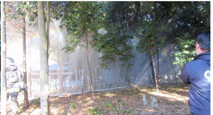
水幕ホースからの放水