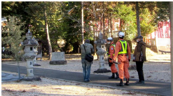
報道関係者に説明 (8:57)

寒い中、神社と消防署による消防訓練が行われました。中日新聞、東濃ニュース、おりべネットワークが取材に来ていた。