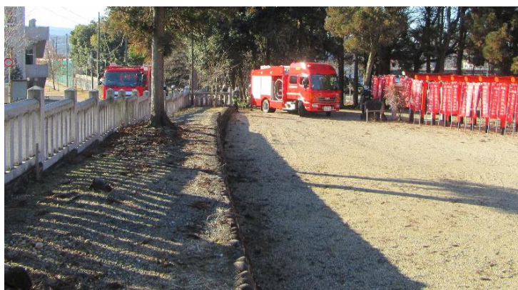
消防車 南側に2台到着 (9:12)