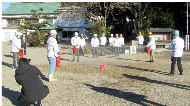
水消火器による消火訓練