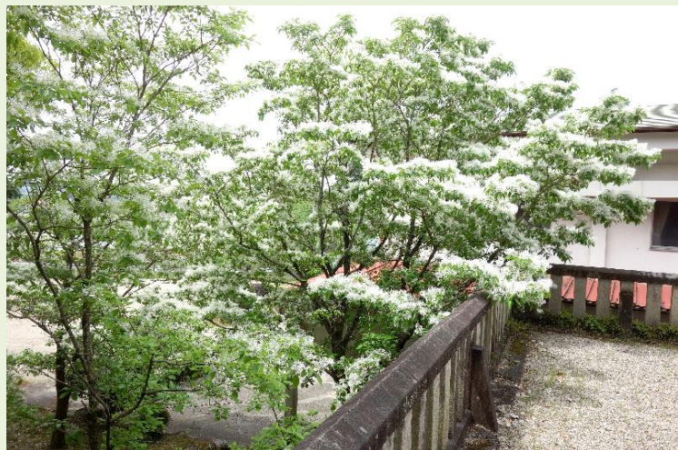
境内西端のヒトツバタゴ