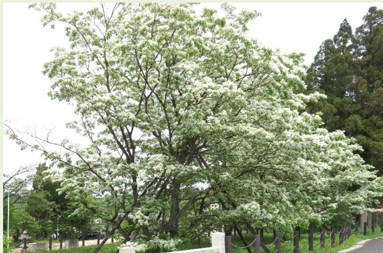
天然記念物エリア内のヒトツバタゴ（東道路より）

令和6年4月29日(月) ヒトツバタゴが開花 ヒトツバタゴが開花しました。5月の連休中が見ごろです。