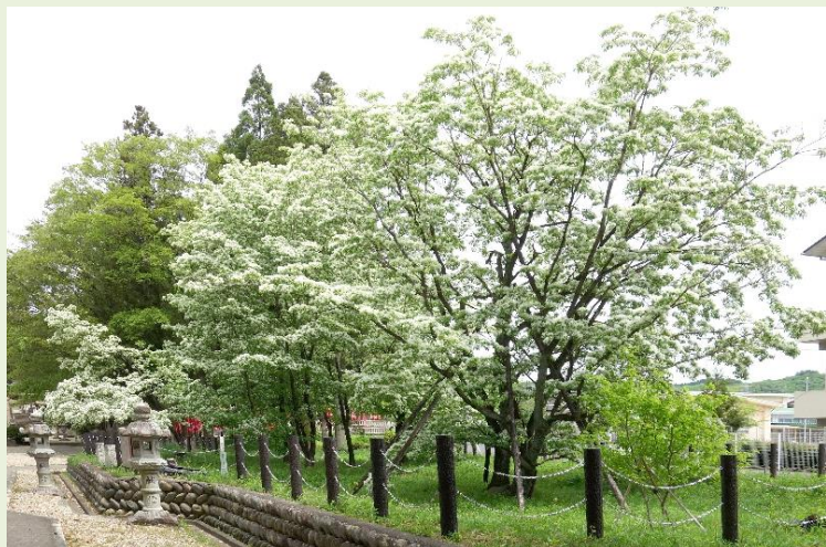
天然記念物エリア内のヒトツバタゴ（参道より）