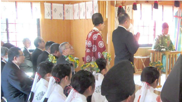
還暦代表者 玉串奉奠