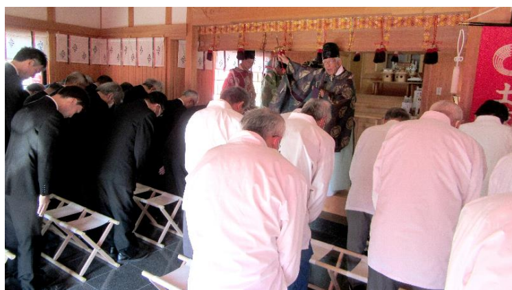
鉦鈴(ほこすず)拝載(はいたい 謹んで受ける意)