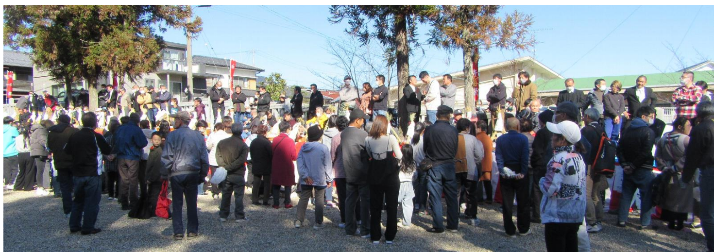
20 町内会の餅投げ準備も完了