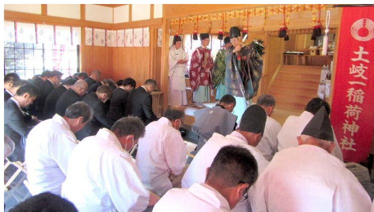
鉾鈴(ほこすず)拝載