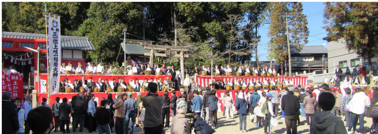
神社関係・消防団・古希 厄年・大富区・還暦