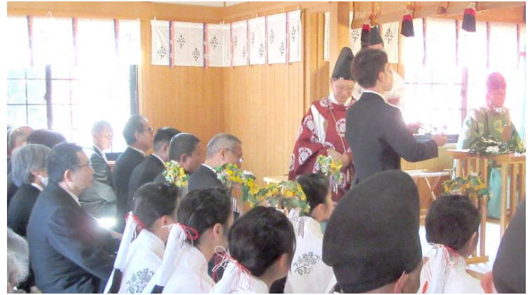
厄年代表者 玉串奉奠