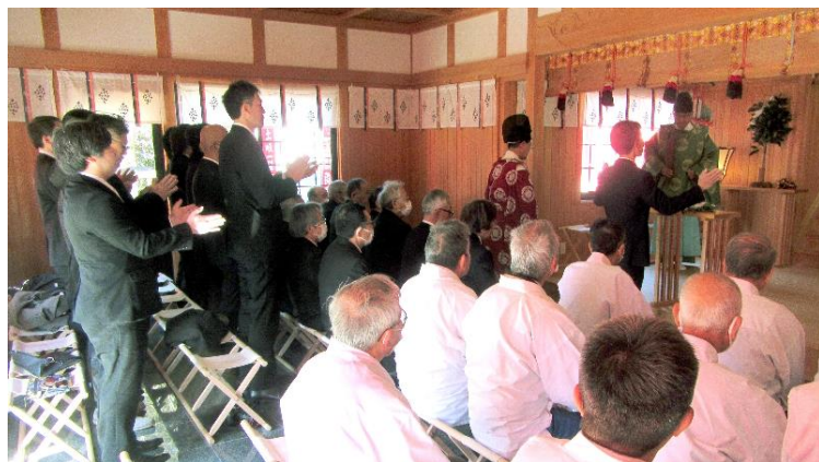
厄年代表者 玉串奉奠