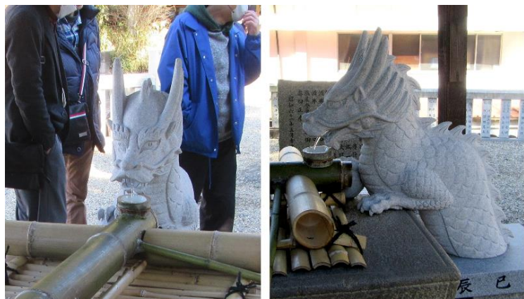
奉納された竜ノ口