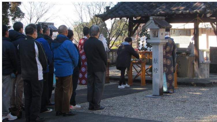
女性代表の玉串奉奠