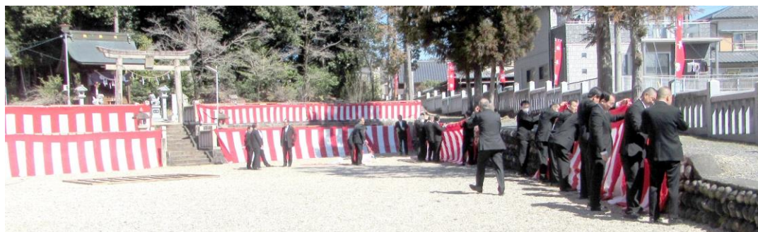
紅白幕の設置作業が進んでいます