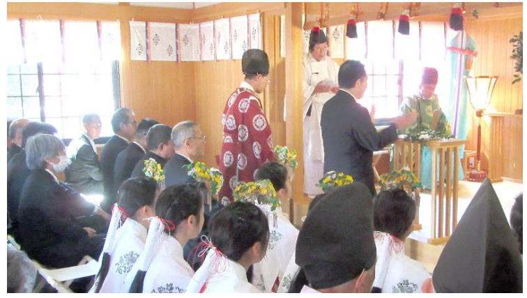
古希代表者 玉串奉奠