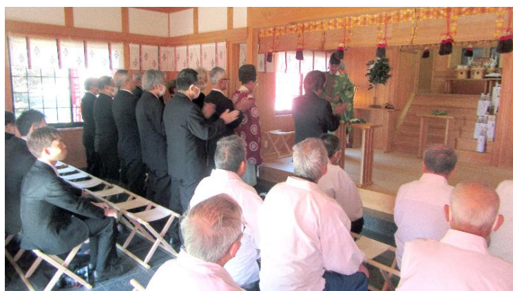
古希代表者 玉串奉奠