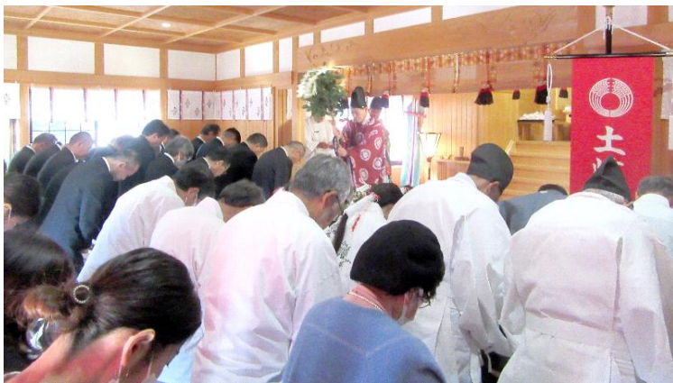
修 祓 (13:52)