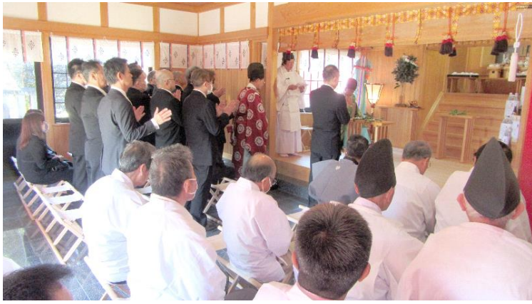
還暦代表者 玉串奉奠