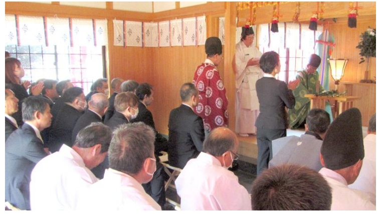
女性代表者 玉串奉奠