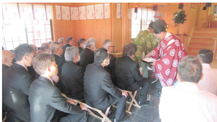
御札・お守り授与 (10:26)