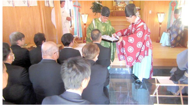
御札・お守り授与 (13:02)